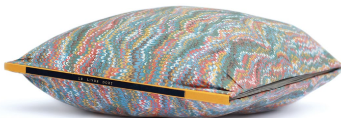
A. Briand, Le livre dort , 2012, emboîtement dos toile, titre or sur pièce de titre en chagrin noir, plats en coton (parure de lit Descamps des années 1980), 55 x 55 cm.