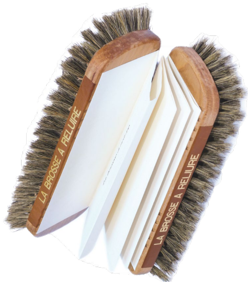
A. Briand, LA BROSSSE À RELUIRE , 2015, brosses à reluire, papier Japon 120 g, titre or sur pièce de titre en cuir, 11 x 25,5 x 8 cm.