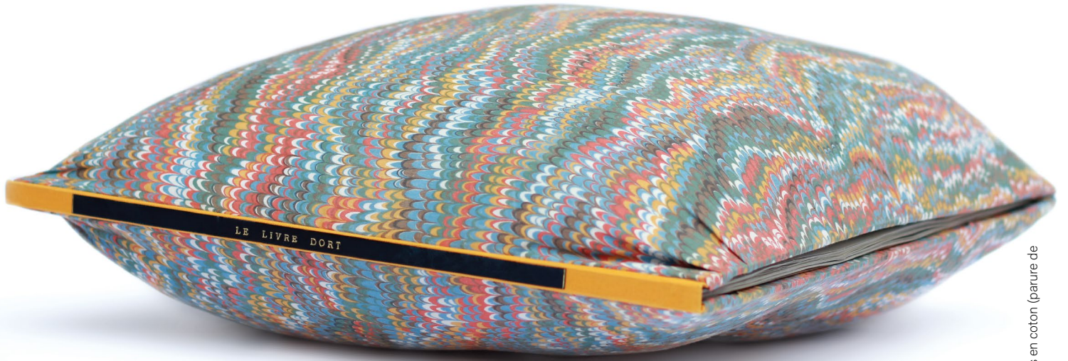
Le livre dort, 2012, emboîtement dos toile, titre or sur pièce de titre en chagrin noir, plats en coton (parure de lit Descamps des années 1980), 55 x 55 cm.