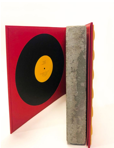
A. Briand, Le plat pays , 2024, pavé provenant de travaux urbains à Bruxelles, emboîtement dos arrondi en chagrin noir, titre or, couverture en matériau podo-tactile, plats et gardes en toile buckram noir et rouge et papier jaune, 33,3 x 31,1 x 6 cm, 12 kg.

Visuels libres de droits pour la presse associationdupatrimoineartistique.be > Actualités