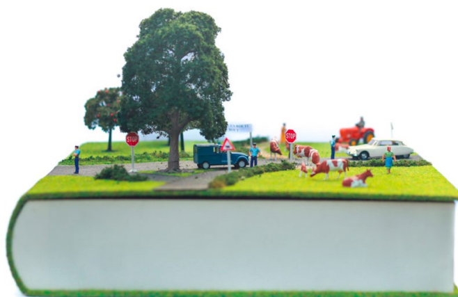
A. Briand, Le code de la route , 2010, boîte en carton, matériaux de modélisme, cuir lisse, couture brochure en fil bleu, papier marbré Annonay, papier kraft, papier rose, fausse pelouse, 36,5 x 29 x 19 cm.